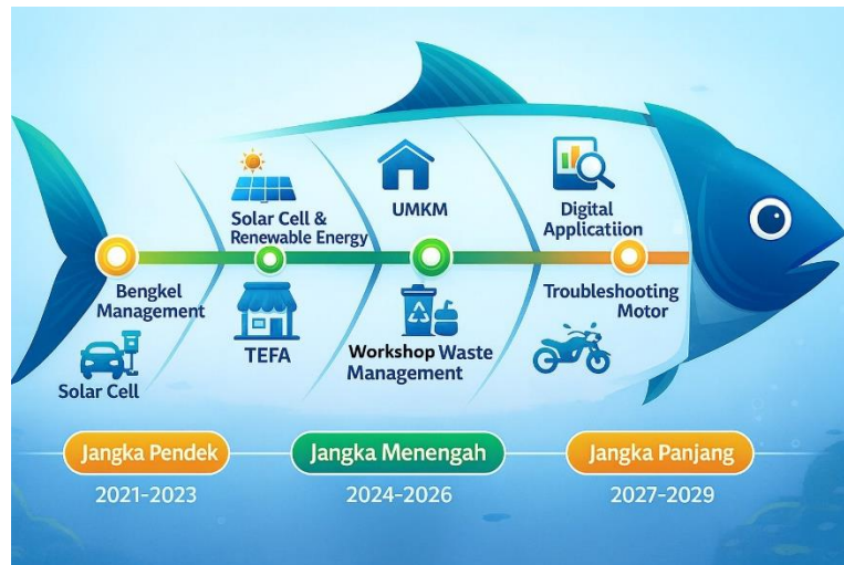
Gambar 3. Roadmap pengabdian Prodi S1 Pendidikan Teknik Otomotif