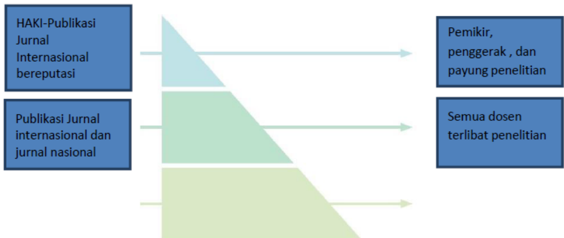
Gambar 1. Proyeksi Karya Dosen Prodi S1 Pendidikan Teknik Otomotif

Pada tahun 2026, Prodi S1 Pendidikan Teknik Otomotif diharapkan sudah memiliki